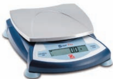
SPU601, SPU2001, SPU4001, SPU6001, SPU6000