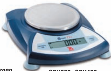
SPU202, SPU402, SPU602, SPU401